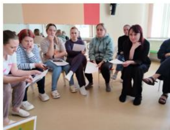
Рисунок 2 – Презентация и обсуждение конспектов организации и проведения сюжетно-ролевых игр