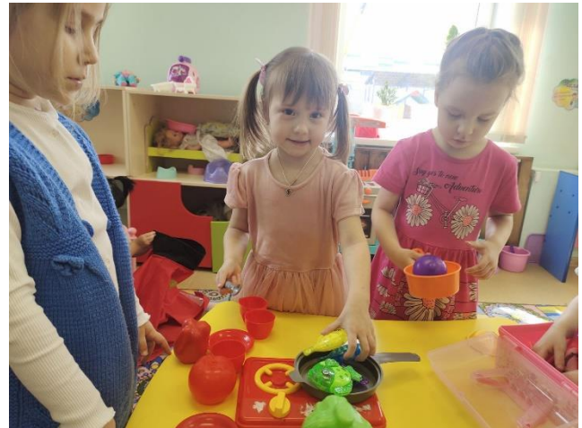
Рисунок 3 – Организация и проведение сюжетно-ролевых игр (школа, ателье, кафе, больница, семья)