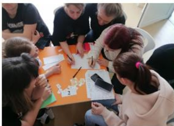
Рисунок 1 - Проведение семинаров- практикумов